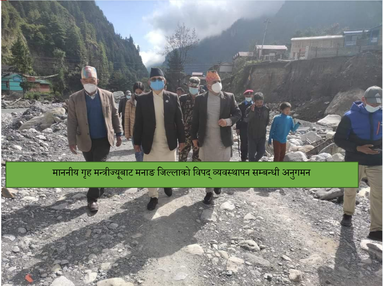
माननीय गृह मन्त्रीज्यूबाट मनाङ जिल्लाको विपद् व्यवस्थापन सम्बन्धी अनुगमन